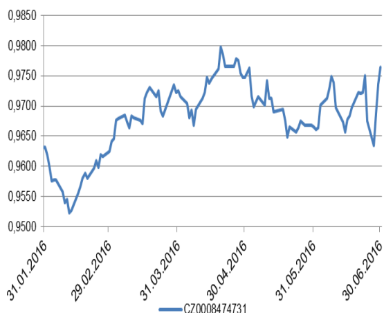
Vývoj hodnoty podílového listu