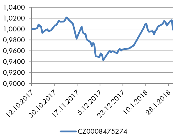
Vývoj hodnoty PL